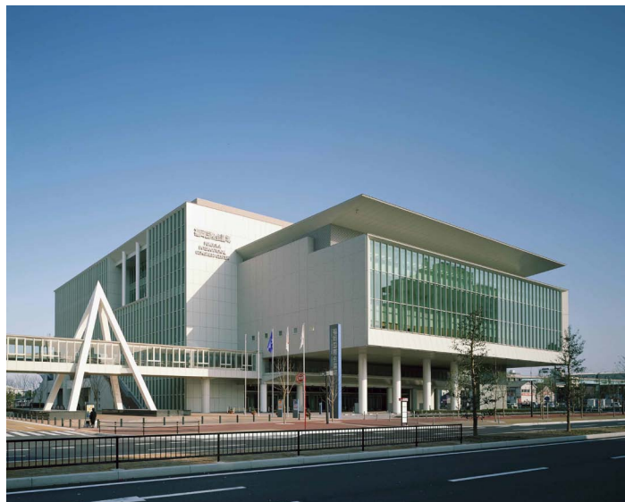
福岡国際会議場 外観

参加登録者は昨年約 1250 人でしたので、本年度もほぼ同程度と見込んでおります。